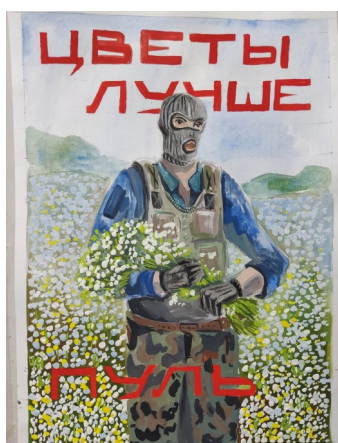
↑ 1 место - Щербакова Ольга, 331 группа