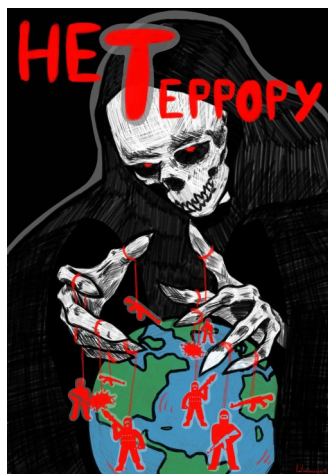
↑ 2 место - Шиманская Елизавета, 123 группа