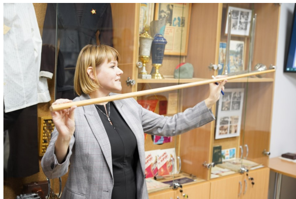
На экскурсии в Музее истории колледжа

- Живая, интересная, актуальная - так можно сказать об обновлённой выставке. У музея огромные