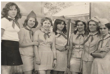
Вожатые пионерлагеря «Искорка», 1970-е г.г.