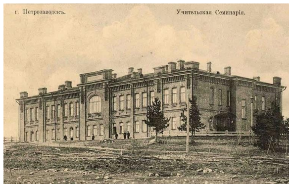
г. Петрозаводск. Учительская семинария. Открытка «Учительская семинария города Петрозаводска», начало 1900-х г.г.