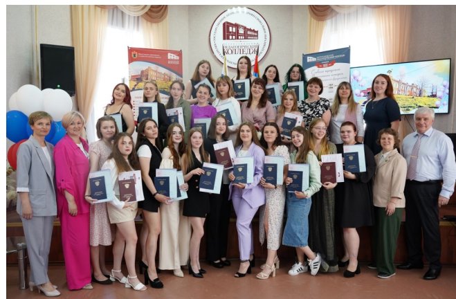
Вручение дипломов педагогам дополнительного образования 2023 г.

В колледже активно работает центр воспитания, развивается деятельность первичного отделения Российского движения детей и молодежи «Движение первых». Формированию оптимальной социокультурной среды и единого воспитательного пространства способствуют различные службы колледжа: социально-психологическая служба, библиотека, спортивный клуб, Студенческий и Музейный советы, кружки дополнительного образования. Специалистами создаются условия для активной жизнедеятельности молодежи, самоопределения и самореализации в различных сферах деятельности.