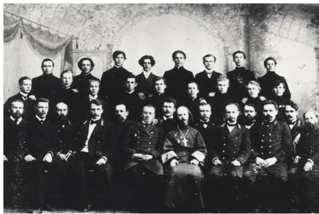
Выпуск мужской учительской семинарии, 1906 г.

Октябрь 1917 года внёс свои коррективы в подготовку учительских кадров. Учебное заведение снова поменяло свое название на «Советская учительская семинария г. Петрозаводска». Стране нужны были учителя, повсеместно открывались школы. Ликвидация безграмотности стала одним из приоритетных направлений государственной политики. 1 сентября 1920 года Петрозаводская учительская семинария была преобразована в двухгодичные педагогические курсы. Студенты и преподаватели курсов активно включились в процесс обновления системы образования, оказывали всемерную помощь подшефным сельским школам.