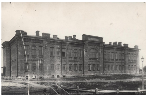
Мужская учительская семинария, 1910-е годы

120 лет это миг для истории. Но он вместил в себя несколько поколений судеб. Итак, по волнам памяти: мужская учительская семинария, педагогический техникум, педагогическое училище и, наконец, педагогический колледж... 24 ноября 1902 года было принято высочайшее распоряжение об учреждении в Петрозаводске учительской семинарии. 25 сентября 1903 года в газете «Олонецкие губернские ведомости» сообщалось, что торжественное открытие мужской учительской семинарии состоялось 25 сентября 1903 года. Это было первое образовательное учреждение для подготовки учителей начальных классов. В семинарию поступали в основном лица крестьянского сословия православного вероисповедания, окончившие уездное училище. Первый выпуск составил семнадцать будущих учителей. Первые два года семинария не имела своего здания и арендовала разные помещения для проведения занятий. Но 21 сентября 1905 года состоялось торжественное открытие нового двухэтажного здания учебного заведения на высоком берегу реки Неглинки. Это было одно из самых больших и красивых зданий Петрозаводска того времени. В семинарии была библиотека, включающая 1445 названий, оборудованы кабинеты физики, естествознания, гимнастический зал и другие учебные помещения.