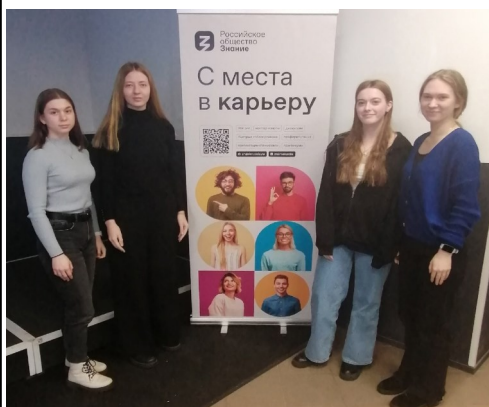
Студенты 111 группы колледжа

Студенты колледжа приняли участие в Молодёжном форуме, организованном Центром карьеры и Российским обществом «Знание». Встреча состоялась 9 и 10 марта в Петрозаводском государственном университете. В центре форума - открытые площадки для диалогов и дискуссий между успешными предпринимателями, бизнес-тренерами, руководителями крупных проектов и молодёжью - студентами и выпускниками высших профессиональных учебных заведений и учреждений среднего про-